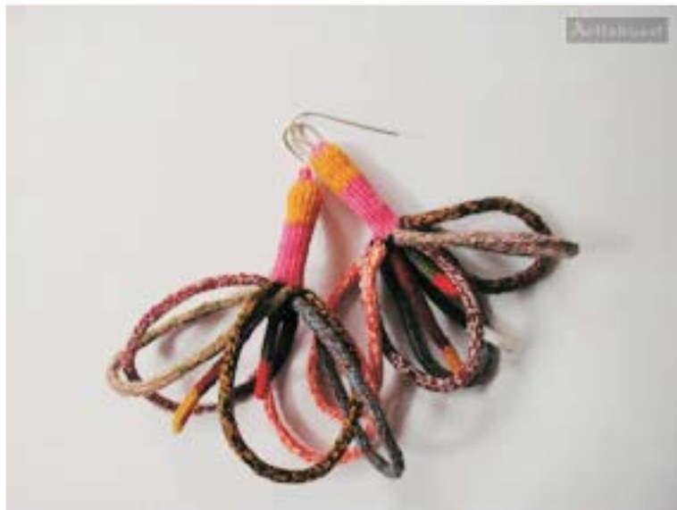
Aros Flor Aflo 001

Técnica textil: "Anillado cruzado" Materiales: Alma y Tejido: algodón Terminaciones: Plata de Ley 950