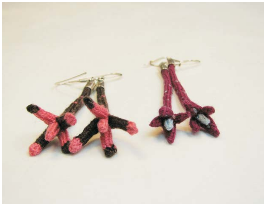
Aros Flor fina Af 002

Técnica textil: "Anillado cruzado" Materiales: Alma y tejido: algodón Terminaciones: Plata de Ley 950