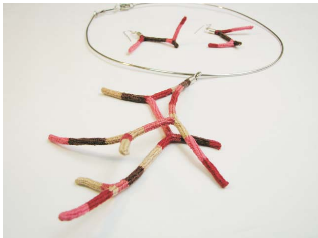
Técnica textil: "Anillado cruzado" Materiales: Alma y Tejido: algodón Terminaciones: Plata de Ley 950

Largo mayor del colgante: 10 cms. Diámetro de la tiara: 15 cm. Largo mayor de los aros : 6 cms.