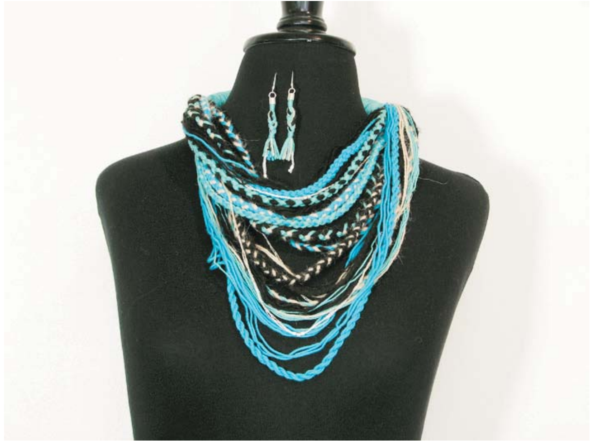
Collar - Bufanda Pequeño y Aros Simples Cb 002 (collar), As 001 (aros)

Técnica textil: "Cordones, trenzado y embarrilado" Materiales: algodón, lana de oveja y alpaca Terminaciones: botones de diferentes materiales y plata de ley 950