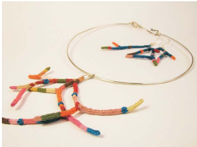
Conjunto de colgante y aros COLG 001 (colgante), Aflo 001 (aros)