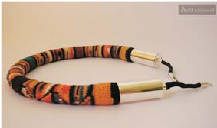
Collares y aros con motivos precolombinos Cg 001 (collar), At 002 (aros)