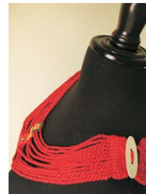
Collar Rojo con torsiones múltiples Ct 001

Técnica textil: "Anillado cruzado" y torsiones