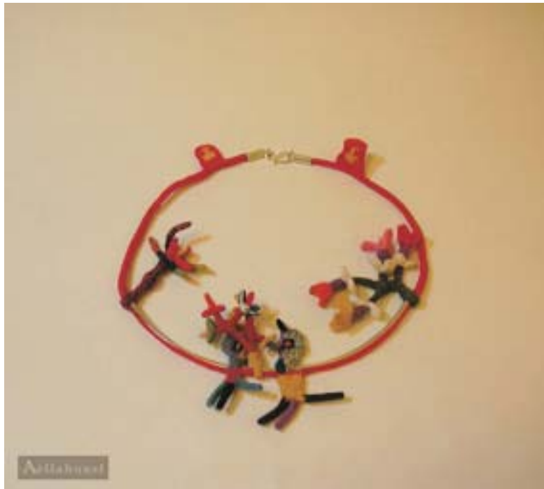
Collar tridimensional con pájaros y flores Ctri 001

Técnica textil: "Anillado cruzado" Materiales : Alma y Tejido: algodón Terminaciones: Plata de Ley 950