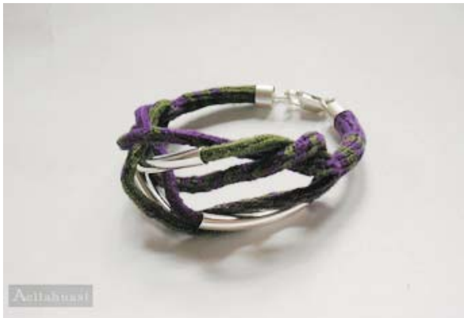
Pulsera Múltiple PUmulti 001

Técnica textil: "Anillado cruzado" Materiales: Alma y tejido: algodón Terminaciones: Plata de Ley 950