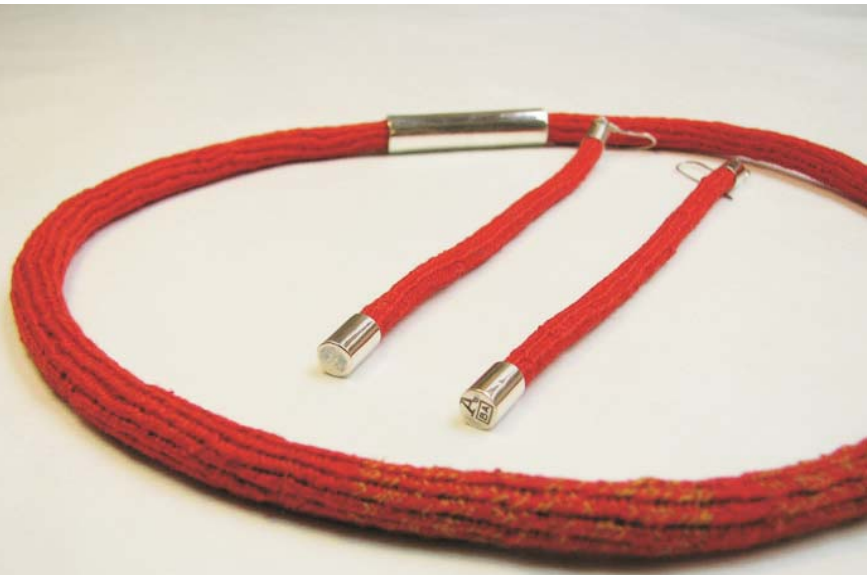
Collares y aros tubulares simples Cs 001 (collares), At 001 (aros)